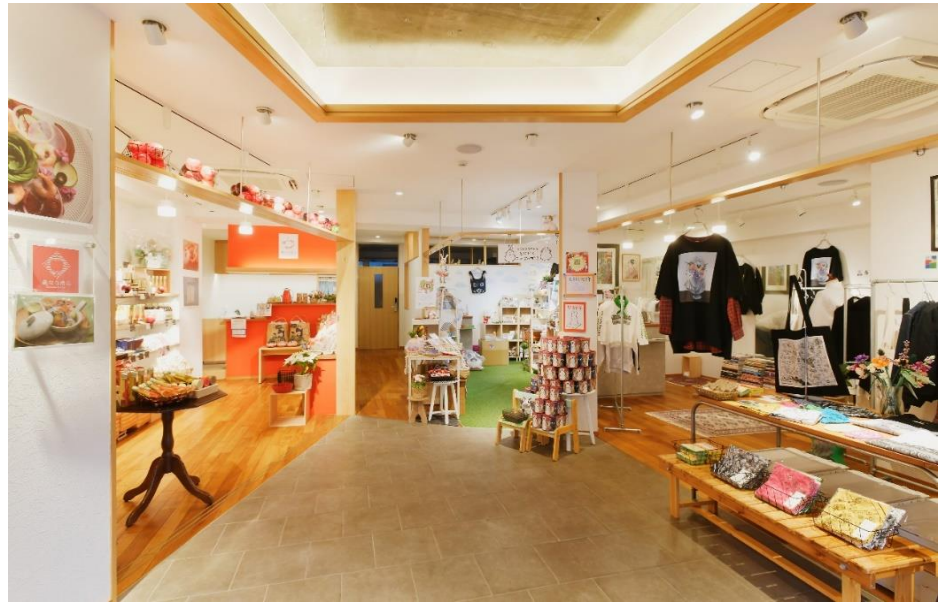
左・テナントC、中央・テナントB、右・テナントA