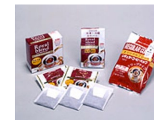
コーヒー用フィルターとしては粉漏れが少なく、コーヒー本来の美味しさの提供にも貢献している。

秘密保持契約の作成・実施にも取り組んだ。また、公証人役場を利用したノウハウの保護施策も実施した。「小さい会社ですから、ノウハウとして保護する手段も大切です。例えば、私たちが先行して開発していた技術について、後からお客様の要求によって変えたものを、先方の特許や共同特許にされてしまったら困りますからね。そこで、私たちがノウハウとして既に持っていたことを、公証人役場で手続きして確定させる方法や資料のまとめ方を、知財センターのアドバイザーから教えてもらいました。もちろんキーになる技術は特許として守る必要があります」