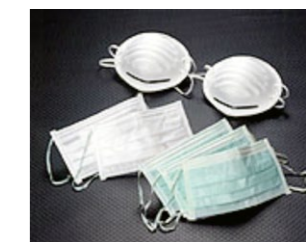
細菌捕集効率は99%以上。しかも呼吸しやすい特性から、医療用マスクの規格に適合。さまざまなタイプのマスクのメインフィルターとして使用されている。