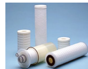
多種多様な液体用フィルターを開発。0.3μm以上の微粒子を除去できるフィルター用の素材として最適である。