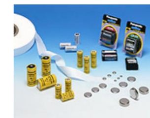
長寿命と信頼性が要求される、リチウム一次電池の多くにも使用されている。