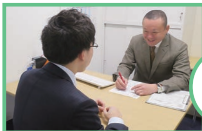
親切・丁寧な相談対応を心がけてます

創業から、経営全般、ICT、IoT、AI化支援、税務・会計、労務、法律、クレーム対応に至るまで経験豊富な専門家が無料で相談に応じ、諸問題解決の参考となるアドバイスをします。