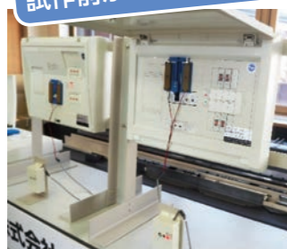
通信建設工事用材料、防災・減災用品の開発及び製作を行う山小電機製作所様

助成金を活用し、地震感知後からブレーカー遮断までの時間を設定でき、かつ、専門工事が不要な地震ブレーカーの検証をしました。技術的課題の検証は、ケースによっては多額になりかねないので、助成を受けられたのは大きかったです！