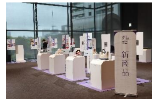
「東京手仕事」プロジェクト発表会(令和5年5月23日開催)

※参加ご希望の方は、下記URLからお申込みください (先着順、100名を予定。申込期間：4月25日(木)から5月16日(木)) https://tokyoteshigoto.tokyo/news/0425/