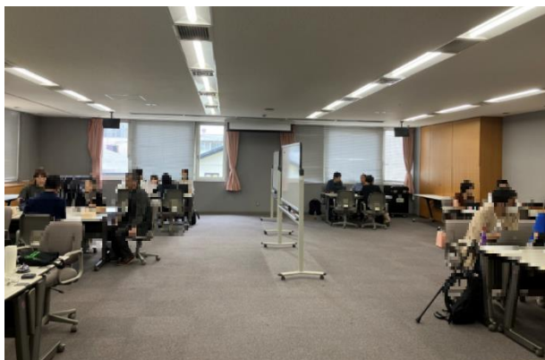
マッチング会の様子(商品開発)