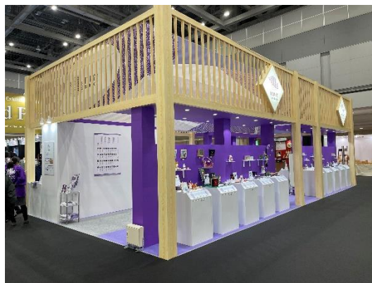
展示会出展の様子(普及促進)