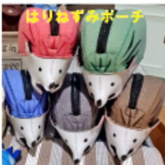
はりねずみポーチ