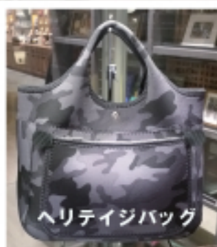
ヘリテイジバッグ