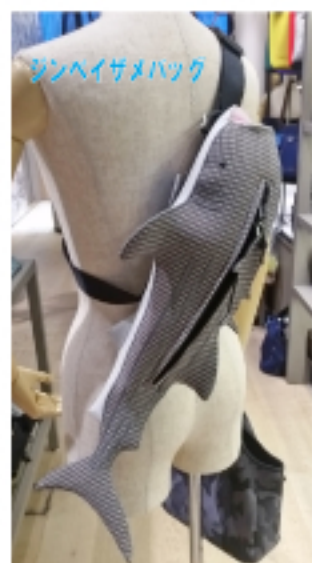
シンハイサメバッグ

ウエットスーツ素材なので～軽くて丈夫 水を通さないの～雨でも安心 汚れても丸洗い可能なので～いつでも綺麗 生地断面の合わせ目は接着+縫製なので～丈夫 壊れてもお直しも受付なので～安心