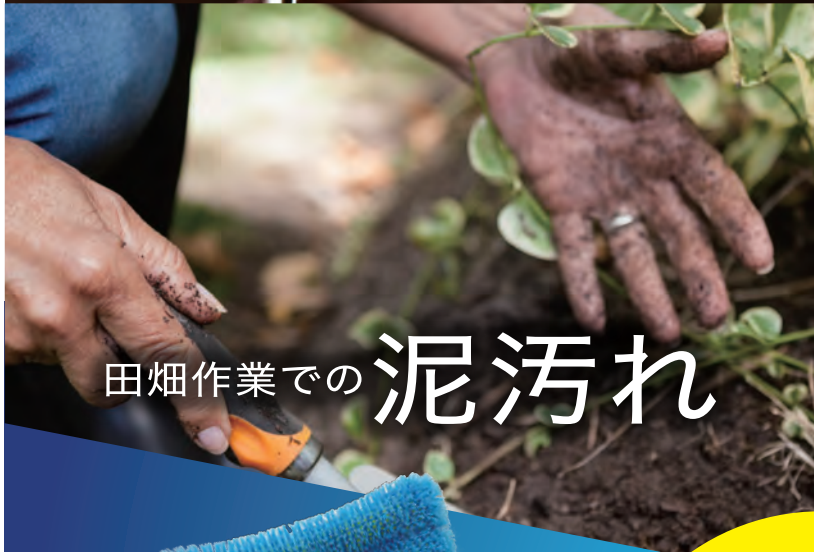
畑作業での 泥汚れ