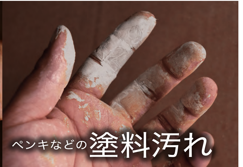
ペンキなどの 塗料汚れ