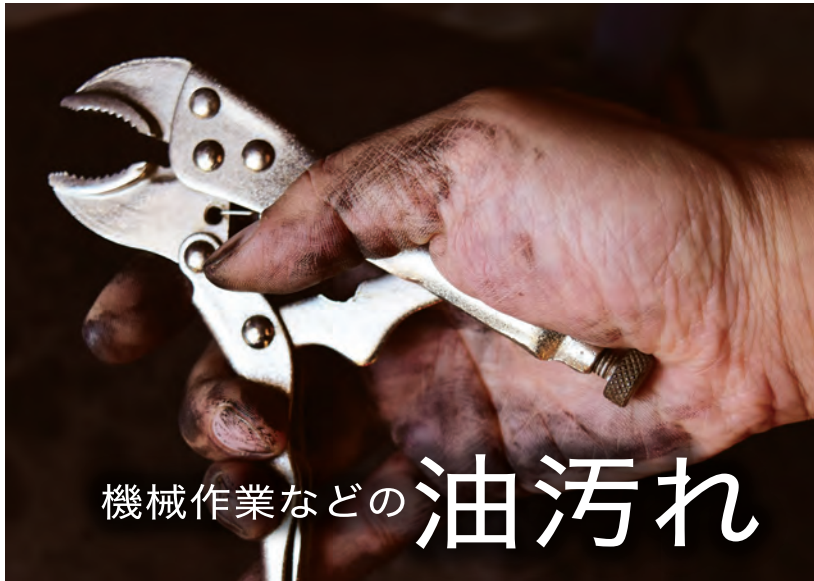
機械作業などの 油汚れ