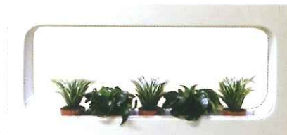
タイプB 個性的な植物で見通しを重視したタイプ