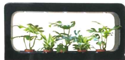
タイプD 緑のパワーを全面に出したタイプ