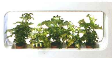
タイプC 涼やかな木立をイメージしたタイプ