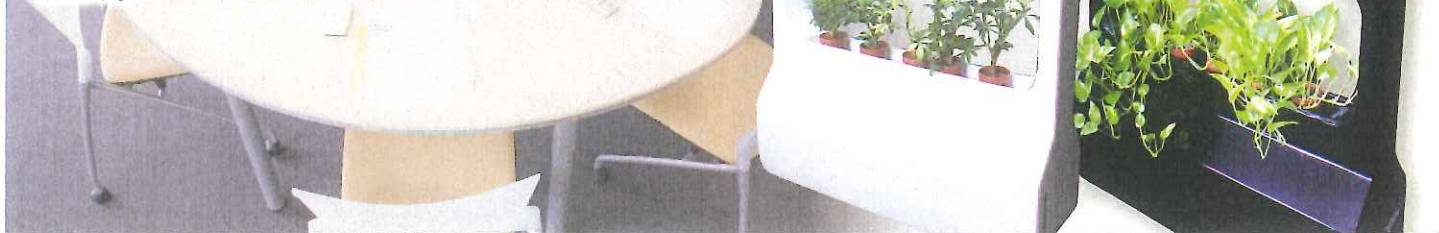
この製品は(公財)東京都中小企業振興公社ニューマーケット開拓支援事業の支援対象製品です。

RERA GREEN は観葉植物を利用した新しいタイプのパーテーション（間仕切り）。各段上部に設置したLED照明が緑を美しくライトアップし、洗練されたスリムなデザインと共に心地よい空間を演出してくれます。独自システムにより水やりは1か月に1回程度、土も使っていないため、手軽に清潔に室内を緑化できます。すでにオフィスや介護施設のラウンジ、ホテルのロビーなどさまざまなシーンで集う人々の心を癒し、潤いを与えています。