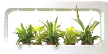
タイプA ツルが伸び、下への変化が楽しめるタイプ