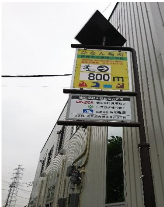
新基準対応型避難誘導標識