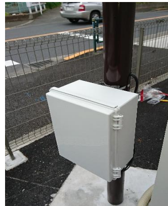
新型全自動制御装置