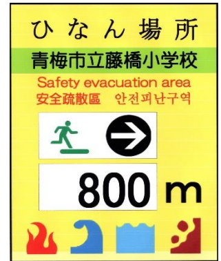
標識表示内容 (4か国語対応)