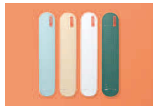
「消せるタイプ」は、2018年の日本文具大賞機能部門優秀賞、グッドデザイン賞を受賞し、機能・デザイン面ともに高く評価されている