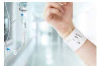
看護師が直接手にメモしている様子を見て、腕に巻いて使用できるメモという着想を得た

定していたため、1回あたりの支払金額が低いと送料がかかることも懸念された。そこで、プリンターとインクのように、バンドとそれに貼るシールをセットで販売することを思いついた。さらに、バンドのシリコン部分のコーティング技術を高めることで直接書いても消せることがわかり、バンドのみで販売することにしたのだ。