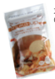
ヌカップ (圧搾脱脂ぬか)

また、搾油もビタミンE・オリザノール等多く含み健康的なオイルとして活用が可能となった。「コメーユ」である。