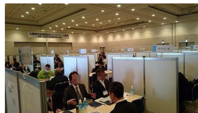
イメージ（昨年度の商談風景）