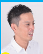
講師 上席執行役員