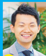
講師 代表取締役 CEO