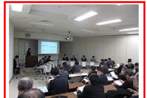
昨年度成果発表会の様子