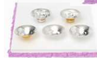
『玉盃ながれ』(東京銀器)

* 参加ご希望の方は、下記詳細をご覧ください、事前にお申込みください(先着順、100名を予定)。