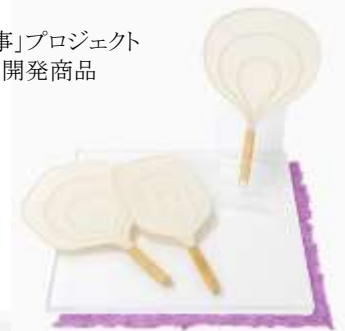
『籐と和紙のうちわ』 (東京籐工芸)