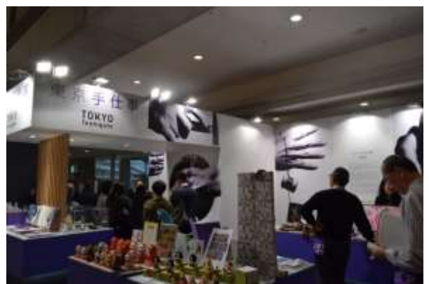
展示会出展の様子(普及促進)