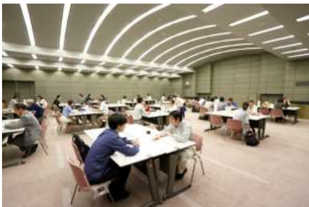
マッチング会の様子(商品開発)