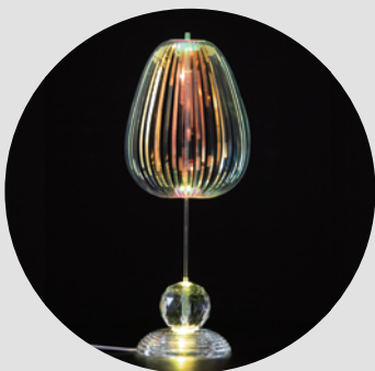
LED Light Stand Set (With LED crystal light stand)