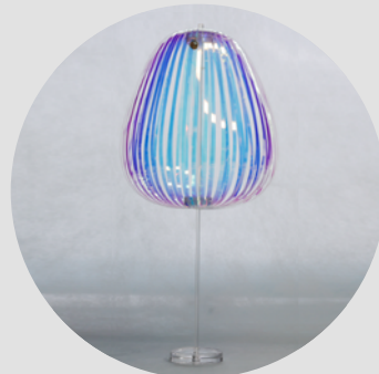
Stand Set (With display stand)