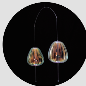
Mobile Display Set (With mobile hanging arm for ambient decoration)