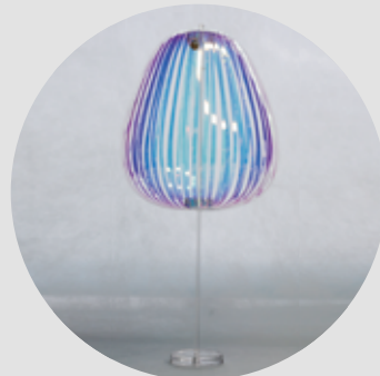
Stand Set (With display stand)