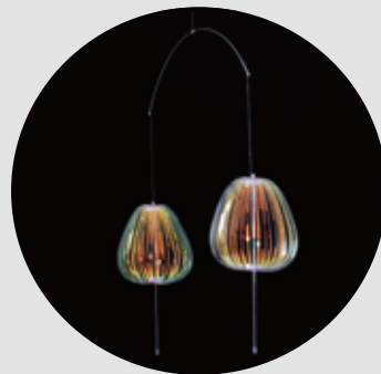
モバイルディスプレイセット