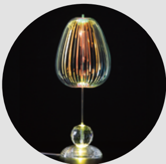
LED Light Stand Set (With LED crystal light stand)