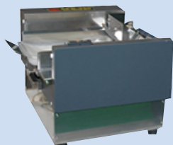
多様なワークに対応の 標準型フィーダー