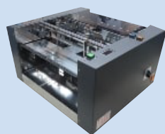
ジッパー袋対応フィーダー