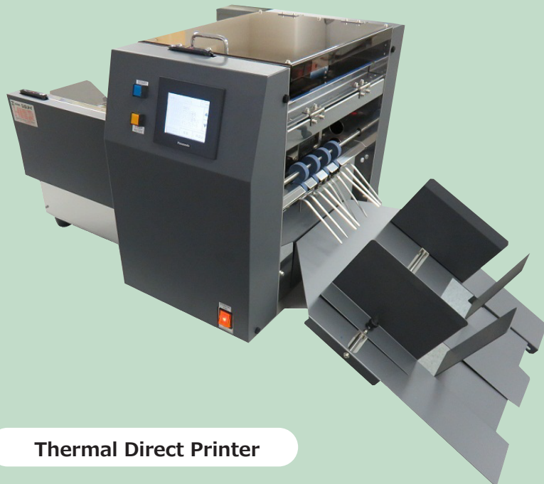
Thermal Direct Printer

New type feeder capable of feeding zipper bags