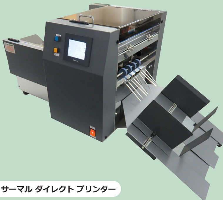
サーマル ダイレクト プリンター