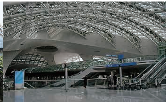
Pipes cut by "Pipe Coaster" are used in various structures