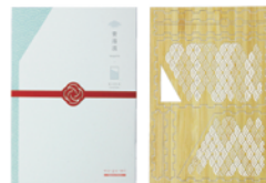
パッケージと中身