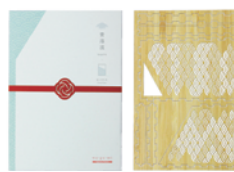
Packaging and product