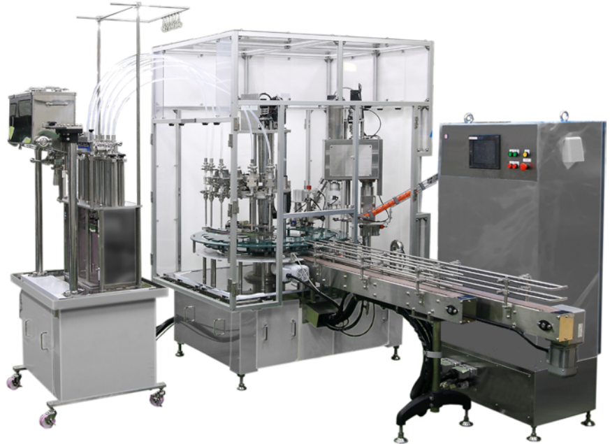
BASIC type BTW (Weighing Turret-type Bottle Filling & Capping Machine)