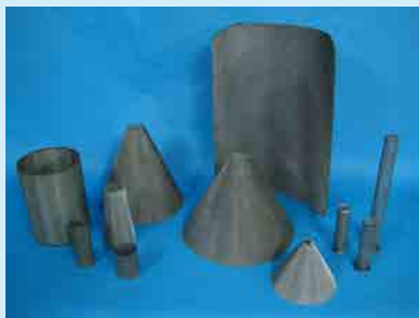
IK screen screen pack-1