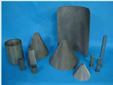
IK screen screen pack-1