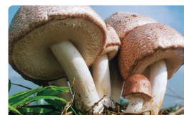
キングアガリクス

BEROOTはアンチエイジングや育毛に関する特許をもとに製品化された育毛/抜け毛/薄毛/白髪改善用のサプリメントです。長年の研究開発から得たエビデンスに基づくBEROOTは、抜け毛/薄毛の改善以外にも冷え性改善、疲労感軽減、睡眠の質改善等、様々な体感を得やすい製品です。