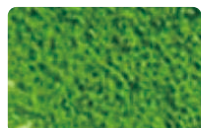
Matcha green tea