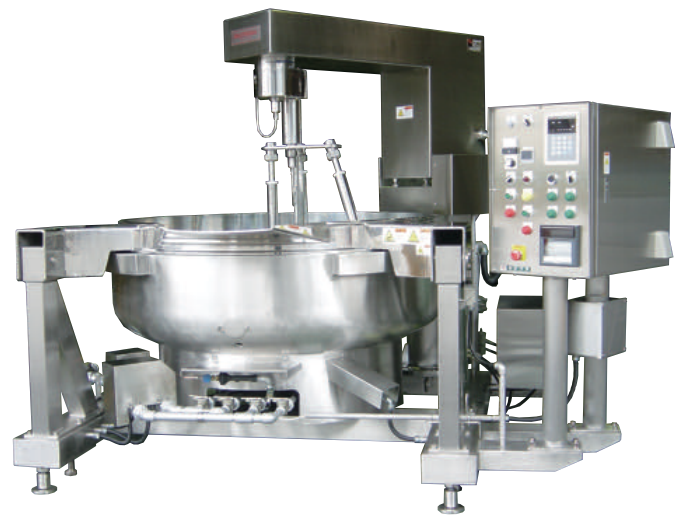
Panci Penggorengan Terbesar Di Dunia Mesin Penggorengan Besar KRS+M

Saus, sup, kuah daging, roux kari, saus kari, mayonaise, selai, saus salad, pasta tepung, aneka bumbu, dll.