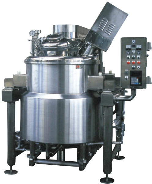
Alat Pengaduk OAM Serba Bisa