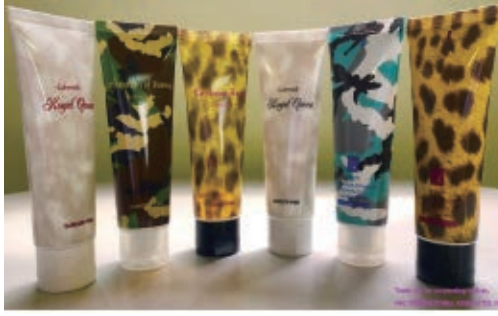
Dry offset samples