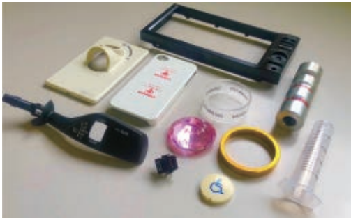
Pad print samples