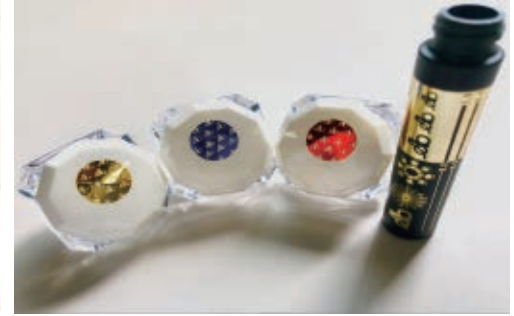
Hot stamp samples