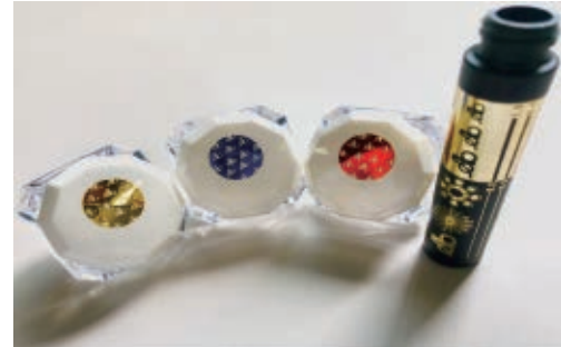
ตัวอย่างการปั๊มขึ้นรูปด้วยความร้อน