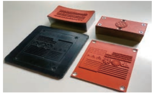
Hot stamp materials