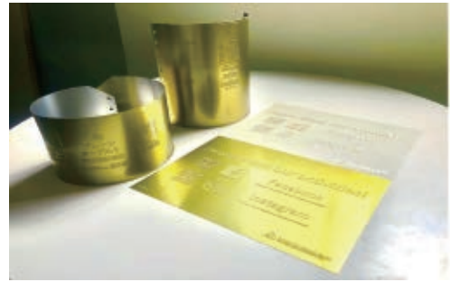
Dry offset materials