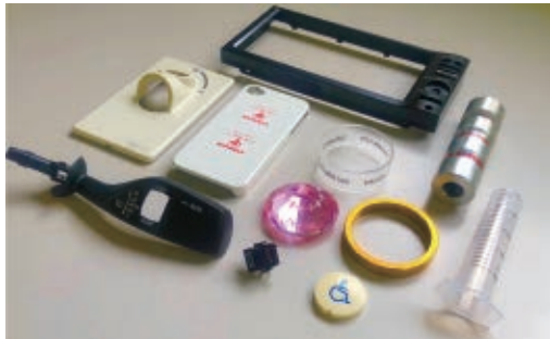
ตัวอย่างการพิมพ์แพด

วัสดุการพิมพ์ (การพิมพ์แพด ดรายออฟเซต การปั๊มขึ้นรูปด้วยความร้อน)