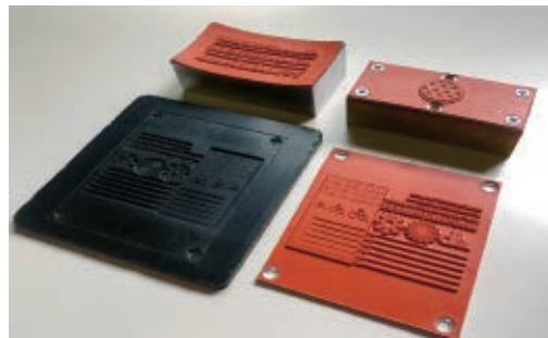
วัสดุปั๊มขึ้นรูปด้วยความร้อน