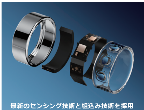
最新のセンシング技術と組み込み技術を採用

個々にスマートフォン上でデータ蓄積、また解析サービスによる 一元管理により、例えば、従業員の方の健康管理にも貢献できます。