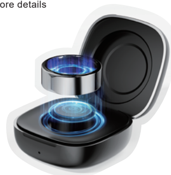
10 days battery life for continuous use per charge (90 minutes)