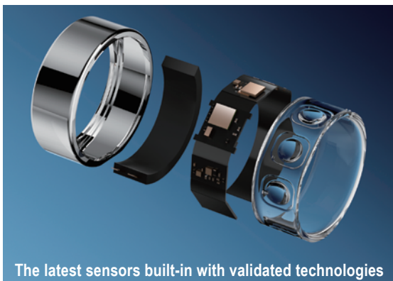
The latest sensors built-in with validated technologies

Total healthcare status shown at 1 screen on your smartphone. For business clients, the storage and analysis service available to customize by group/company/class/team to help motivate employee.