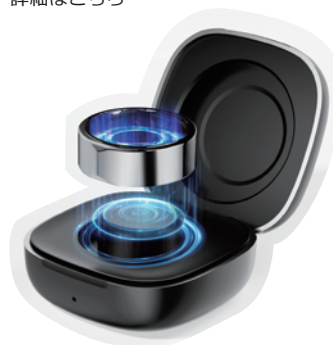
1回の充電(90分)で最大10日間連続で使用可能