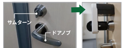
自身で簡単に取付けが可能