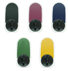
5 Color range