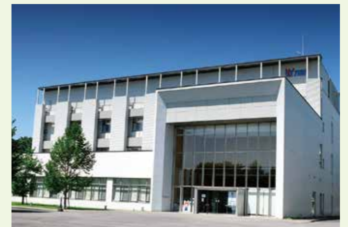
多摩テクノプラザ

技術相談や依頼試験では対応が難しい場合などに、都産技研が保有する技術を組み合わせ柔軟に対応します。