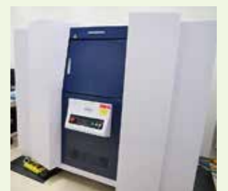
マルチスケールX線CT装置