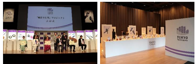
「東京手仕事」プロジェクト発表会(令和4年5月24日開催)