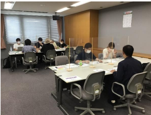
マッチング会の様子(商品開発)