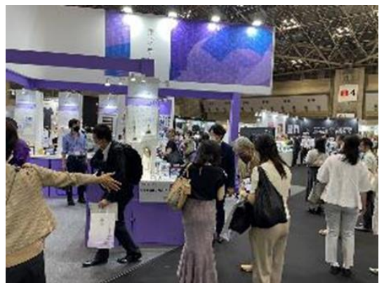
展示会出展の様子(普及促進)