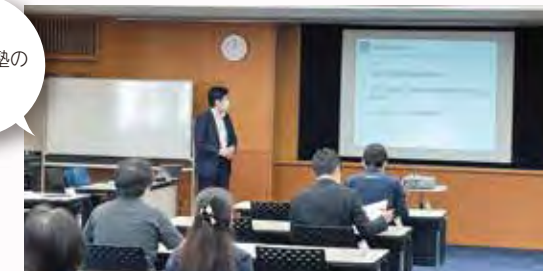
事業承継塾の様子

後継者育成に向けた講座を通じて、事業承継塾では経営者に必須の知識やスキルの習得、後継者イノベーションスクールでは既存事業に留まらず発展的承継への新たな取組を支援します。