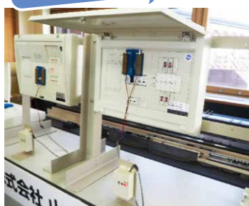
<感震ブレーカの検証> (株式会社山小電機製作所)

震度の設定が可能で、地震感知後からブレーカ遮断までの時間設定が可能な製品の事前検証。技術的検証は多額になりかねないので、助成を受けられたのは大きかった。