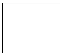
仕上がり B4 タブロイド