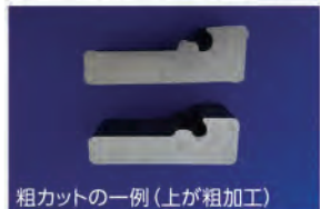
粗カットの一例（上が粗加工）

例) 64チタン・ニッケル合金の粗カット アルミ合金・純チタンなどのカット セラミックス素材のカット