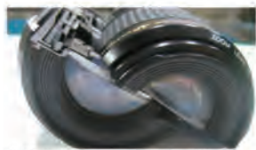
内部構造観察用カットの一例

例) 機密モジュール等の内部構造観察用カット 接合部分や接着状態の観察用カット 瑕疵（クラックや隙間など）の観察用カット