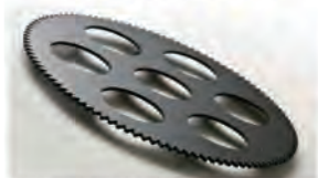
CFRP（炭素繊維強化プラスチック）カットの一例