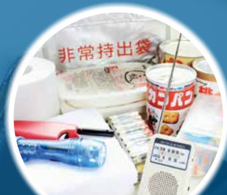
防災備蓄管理サービス