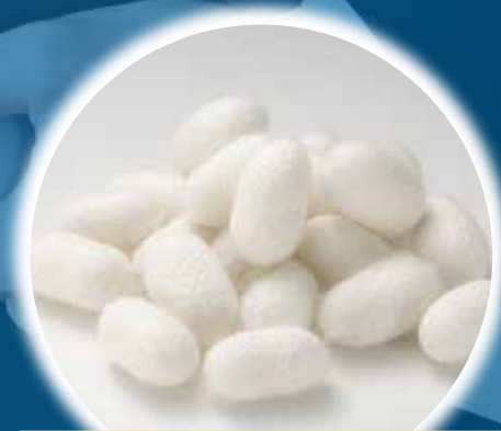
カイコ由来バイオ原料