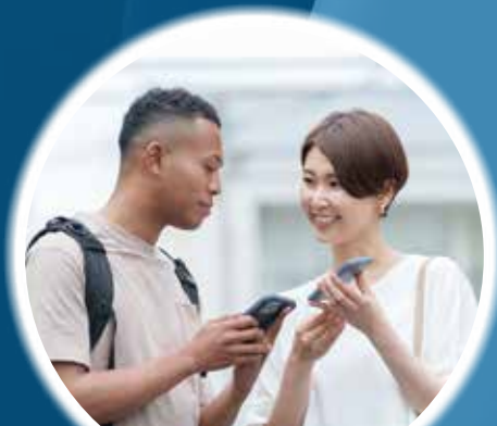
AI 動画翻訳サービス