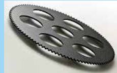
CFRP (炭素繊維強化プラスチック)

様々な素材(金属、プラスチック、樹脂、ガラス、セラミックス、CFRP などの複合材)を切断することが出来る