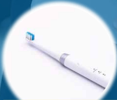
次世代型全自動歯ブラシ