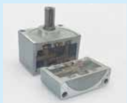
ギアボックス (1カット)