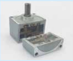
ギアボックス (1カット)