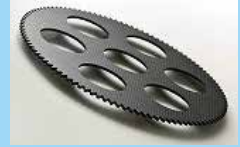
CFRP (炭素繊維強化プラスチック)

様々な素材(金属、プラスチック、樹脂、ガラス、セラミックス、CFRP などの複合材)を切断することが出来る