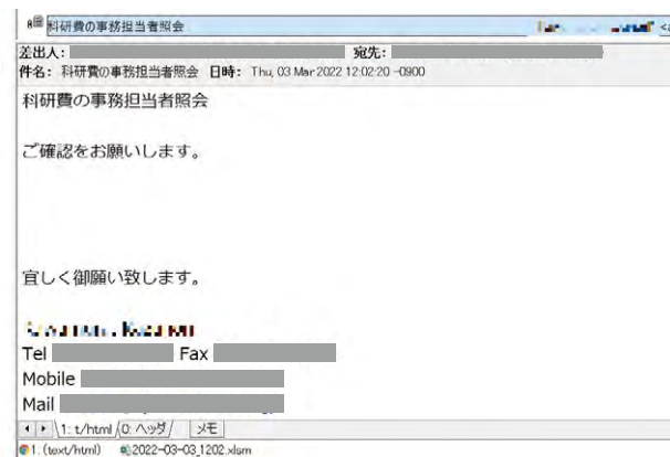
図 Emotet のメールの例

Excelのファイルが添付されているが、このファイルを開くと、Emotetに感染する。