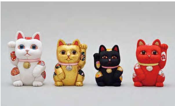
2015年「東京手仕事プロジェクト」の普及促進支援となった招き猫。プリント布地や革など従来の木目込みにない素材を使い、個性が光る