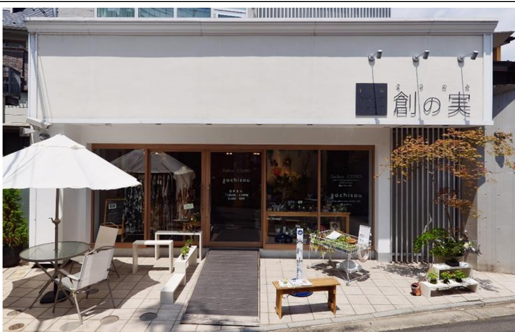
所在地及び店内レイアウト・募集区画