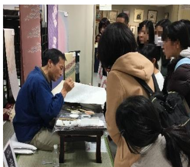
▲ブースツアーの様子