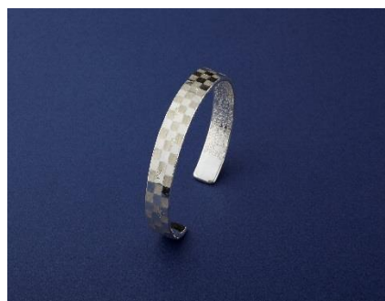
▲東京銀器（伝統工芸品）

U R L 等： https://www.dento-tokyo.metro.tokyo.lg.jp/