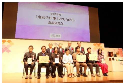
「東京手仕事」プロジェクト商品発表会 (令和7年5月20日開催)

※ 来場希望の方は、下記URLからお申込みください。 https://tokyotesigoto.tokyo/news/260423.html (事前申込制・先着順 / 定員150名) 申込期間 : 4月23日(木) から 5月25日(月)