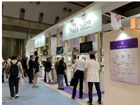
展示会出展の様子(普及促進)