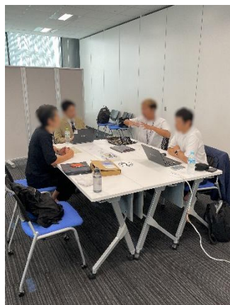
マッチング会の様子(商品開発)