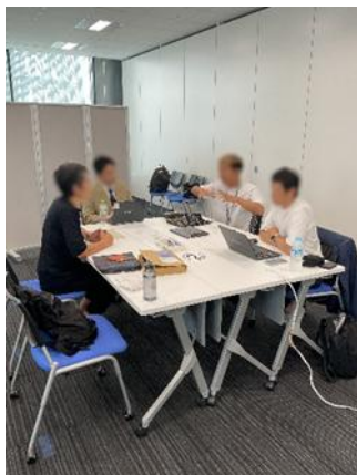
マッチング会の様子(商品開発)