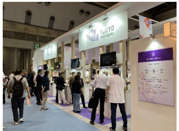
展示会出展の様子(普及促進)