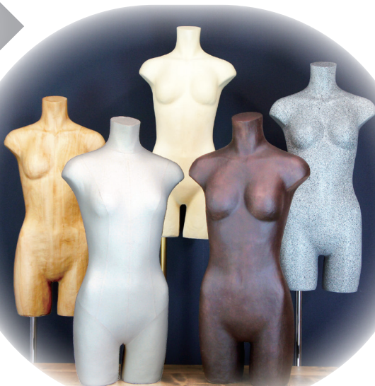
塗装や布縫製をしたトルソー