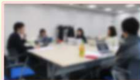
▲活発な議論が交わされます！

女性起業ゼミのご受講は、プランコンサルティングをご利用の方に限定させていただきます。