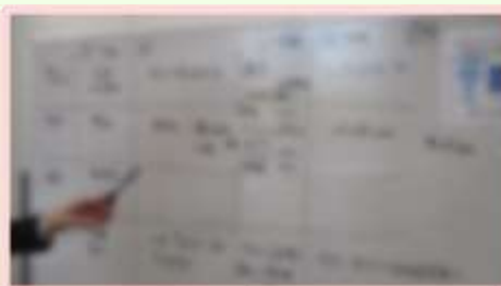
▲受講者の事例でケーススタディ！