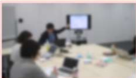
▲講師が近くて、質問しやすい！