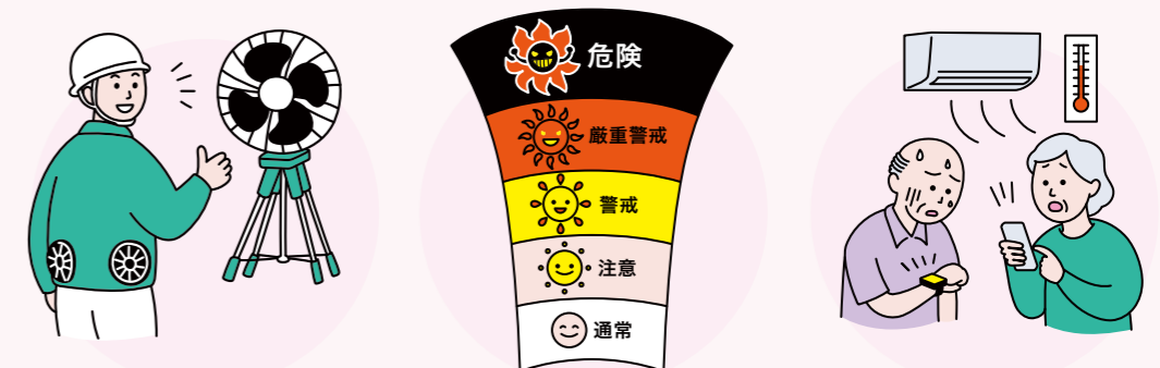
工事現場の暑さ対策