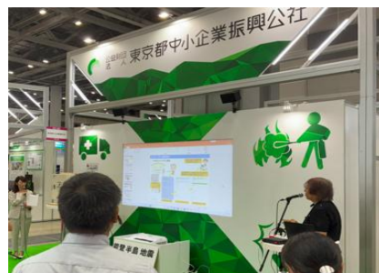
公社ブース内ステージのプレゼンテーション