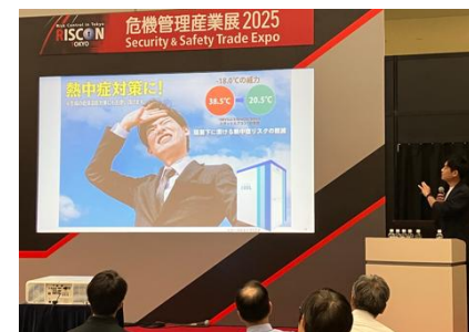
セミナー会場プレゼンテーション