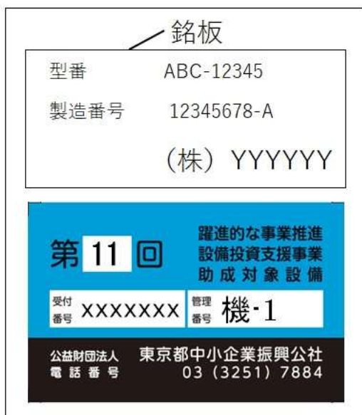
銘板と管理ラベルの写真（例示）

銘板の刻印が不鮮明な場合は写真の露出や明暗を補正したり、可能な限り拡大したり、その他工夫し写真から製造番号等が判別可能となるように工夫してください