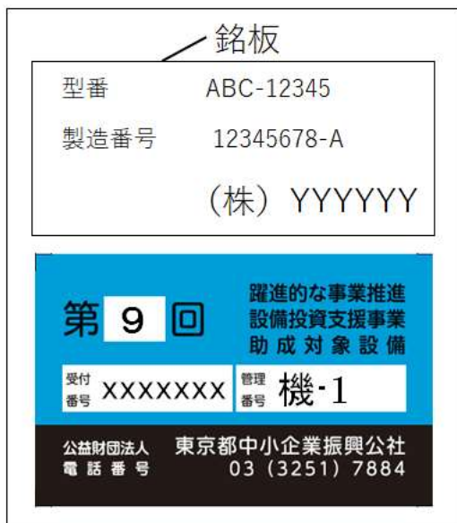
銘板と管理ラベルの写真 (例示)

銘板の刻印が不鮮明な場合は写真の露出や明暗を補正したり、可能な限り拡大したり、その他工夫し写真から製造番号等が判別可能となるように工夫してください