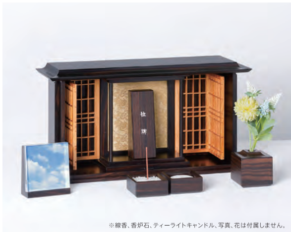
※線香、香炉石、ティーライトキャンドル、写真、花は付属しません。