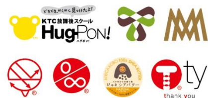
上田氏が手がけたCI企業ブランディングの事例

「No.1企業でなくてもブランディングってできるの？」 「ブランディングって大企業のものでしょ？」 「商品ではなく、企業にもブランディングって必要なの？」 そんな中小企業経営者のギモンに答えます。