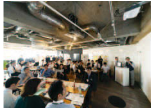
「デザイン経営プロジェクト」キックオフミーティング。プロジェクトのファシリテーターを務めるロフトワークにて行った (2018年10月24日)