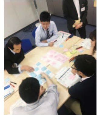
若手職員向け「デザイン思考を活用した課題発見プロジェクト」の様子 (2018年2月16日～3月20日・全7回)

特許庁は産業財産権(特許権、実用新案権、商標権、意匠権)を所管する官庁である。外山氏が所属する意匠部門は、特許庁へ出願される、さまざまなデザイン(意匠)の審査を通じて、企業のビジネスやデザイナーの創作を支える役割を果たしている。特許庁から『「デザイン経営」宣言』が生まれたのは必然のことだったのではないだろうか。