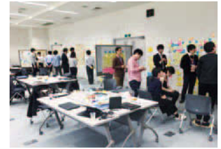
東村山研修所にて、課題設定合宿を実施。活発な議論が交わされた (2018年11月7日～8日)